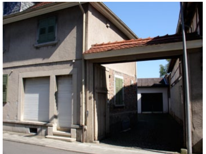
Einige der zukünftigen Bewohner des Rosenhofs beim dortigen Richtfest 2005. Auf dem rechten Bild der Blick von der Straße auf das unsanierte Anwesen.