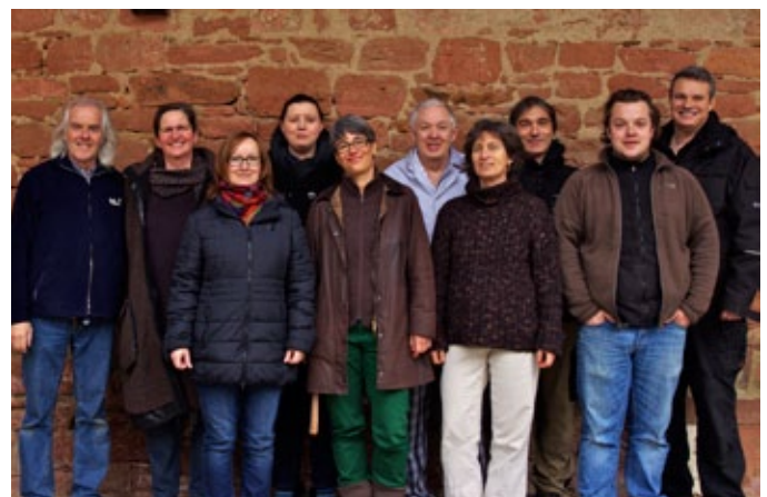
Das Team der Verwaltung im Jahr 2010 und auf dem rechten Foto die Mitarbeiter*innen der WfbM Heydenmühle im Jahr 2014.