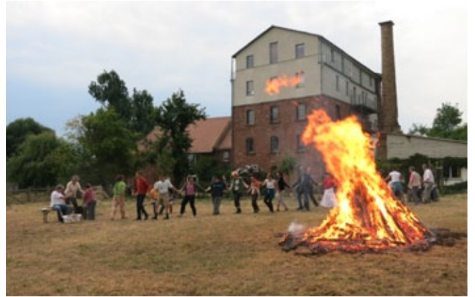
Kunst und Kultur haben einen hohen Stellenwert und wurden über all die Jahre zu verschiedensten Anlässen gelebt. Bild links die Premiere der „Zauberflöte“ 2005, rechts ein Johannifest mit großem Feuer.