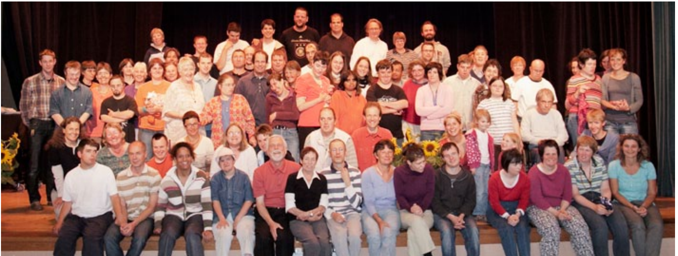
(Fast) alle Heydenmühler für ein Foto im Saal versammelt: Johanni 2011.