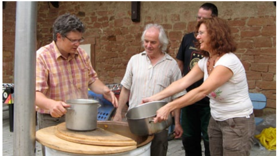
Suppe kochen im Hof, auf dem linken Bild ganz zu Beginn der Sanierung, auf dem rechten Bild an Michaeli 2011.