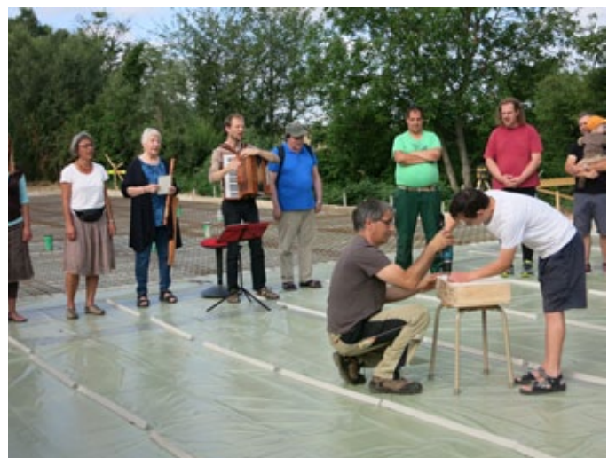
Zwei der zahlreichen Baustellen aus den vergangenen 25 Jahren. Links der Werkstattneubau in der Heydenmühle (2007), rechts die Grundsteinlegung für das ganz neue Werkstattgebäude für TaFö und Weberei.