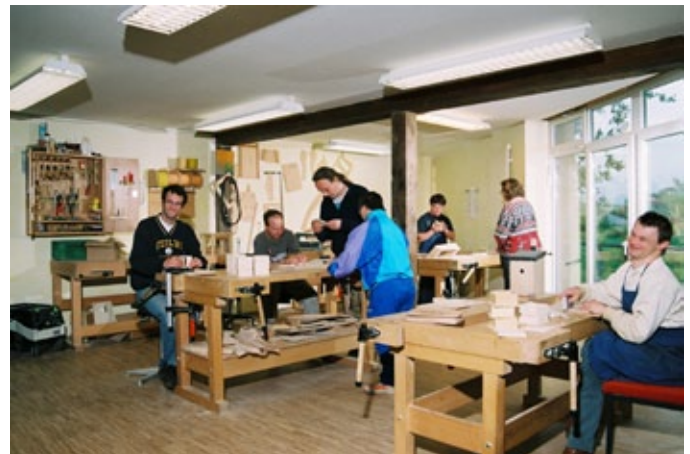
Links ein Foto von der Feier zum 10-jährigen Heydenmühlen-Jubiläum. Rechts ein Foto aus dem Arbeitsalltag der Schreinerei, die damals über der heutigen Wäscherei untergebracht und mit dem Fahrstuhl aus dem Innenhof erreichbar war.